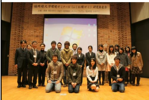
←研究発表会と超大学懇親会↓