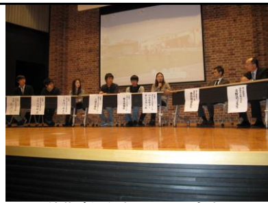
↑秋期勉強会での討論会